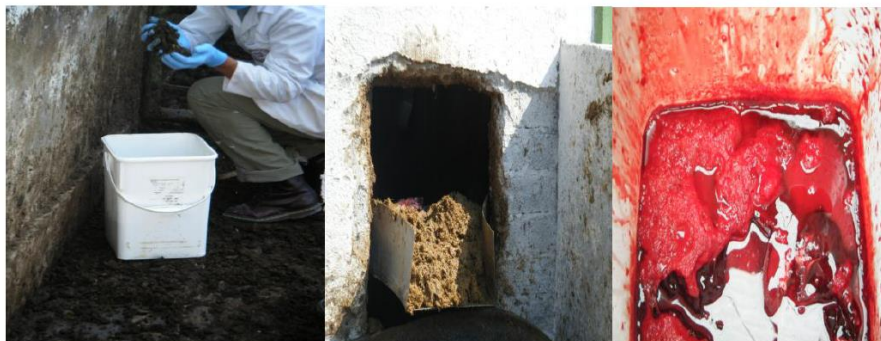
Figura 14 Residuos generados dentro de los rastros: estiércol, contenido ruminal y sangre y vísceras colectadas

Los rastros pueden ser municipales, privados y tipo inspección federal (TIF). El número total de rastros en México es de 1,151 de los cuales 54 pertenecen al Estado de Guanajuato siendo 37 municipales, 10 privados y 7 tipo TIF (SAGARPA, 2013).